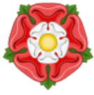
Tudor rose England