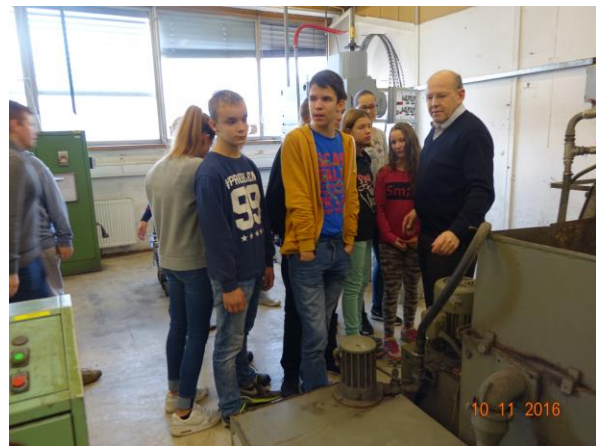
Slika 3: Brusilnica, F. Kopljan dir. proizvodnje

Pokazali smo jim tudi delo delavk v končni kontroli kjer je tudi zadnja faza kontrole in pakiranja magnetov pred odpremo po vsem svetu. Nenazadnje so si ogledali tudi naš laboratorij, galvano in tudi skladišče magnetov in surovin.