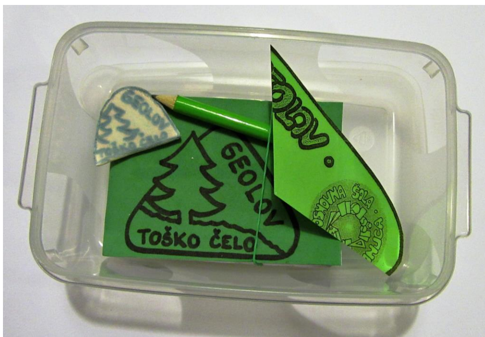
Slika 12: ZAKLAD 3 (plastična posoda za shranjevanje mere: 16 x 11 cm, beležka, svinčnik, spominek za izmenjavo)