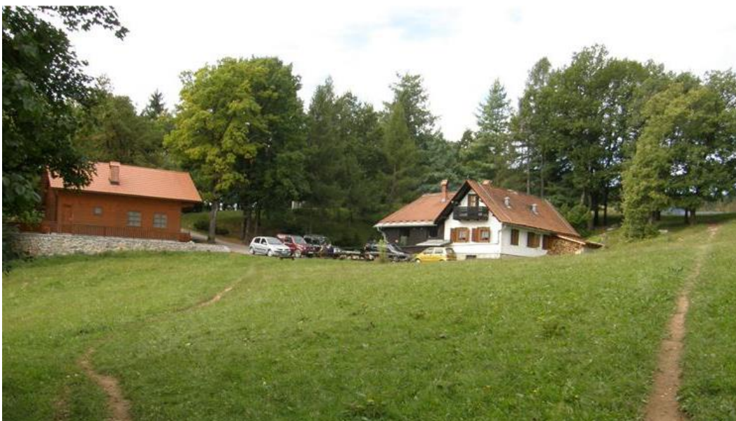
Slika 5: 4. POSTAJA: Lovska koča na vrhu – NAMIG: divji dom