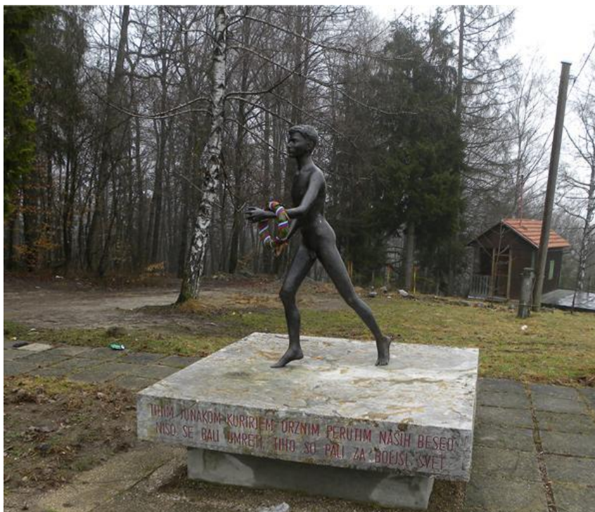
Slika 3: 2. POSTAJA: spomenik padlim borcem – NAMIG: osamljeni par