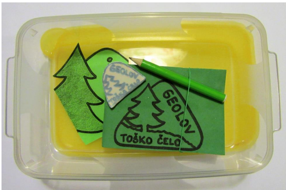
Slika 10: ZAKLAD 1 (plastična posoda za shranjevanje mere: 20 x 12 cm, beležka, svinčnik, spominek za izmenjavo)