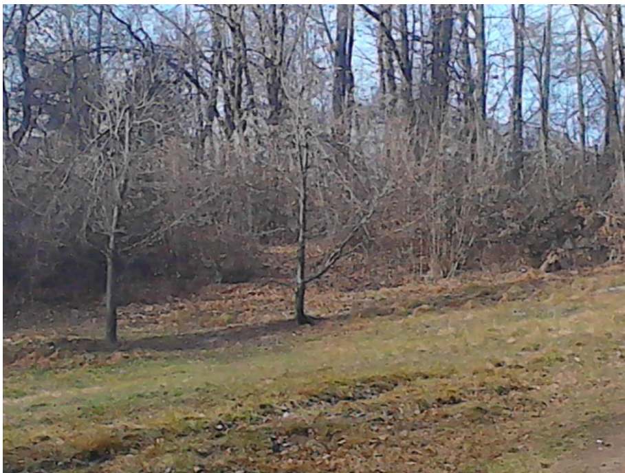
Slika 4: 3. POSTAJA: dve drevesi na obrobju travnika – NAMIG: dvojno zeleno leseno