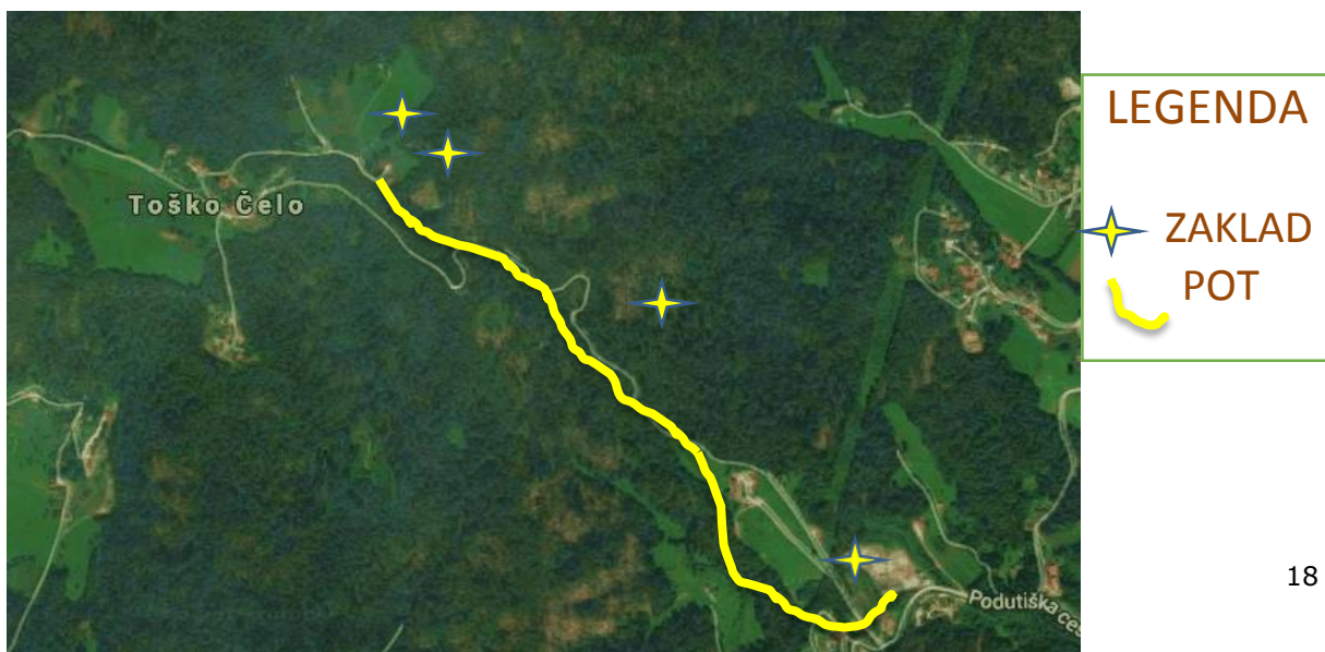
Slika 1: Zemljevid Toškega Čela z označeno traso

Tako bodo tako ekipe kot tisti samostojni detektivi, taborniki in skavti lahko našli zaklade s pomočjo računalniške in satelitske pomoči. Tudi slednji bodo ob izpolnitvi naših pogojev za sodelovanje v nagradni igri (poslanim podatkom in slikam na e-pošto ali FB) imeli možnost sodelovati pri pogozdovanju. Med terenskim delom smo ugotovili, da je pot na določenih odsekih zaradi polomljenih dreves ali vlake lesa lahko nevarna, zato bomo obiskovalce na informativni tabli še posebej opozorili na morebitno nevarnost in previdnost. Ugotovili smo tudi, da je ob poteh v gozdu odvrženih veliko odpadkov, zato bomo na informativni tabli izrecno opozorili na skrbno ravnanje z morebitnimi odpadki (SMETI ODNESI NAZAJ V DOLINO) ter po pridobitvi informacij o lastništvu parcel poskušali doseči postavitev smetnjaka pri manjšem parkirišču on spomeniku padlim borcem. Vse to bomo urejali v dogovoru z lokalno skupnostjo in lastnikom zemljišča (potrebno je zagotoviti ustrezen smetnjak in redni odvoz).