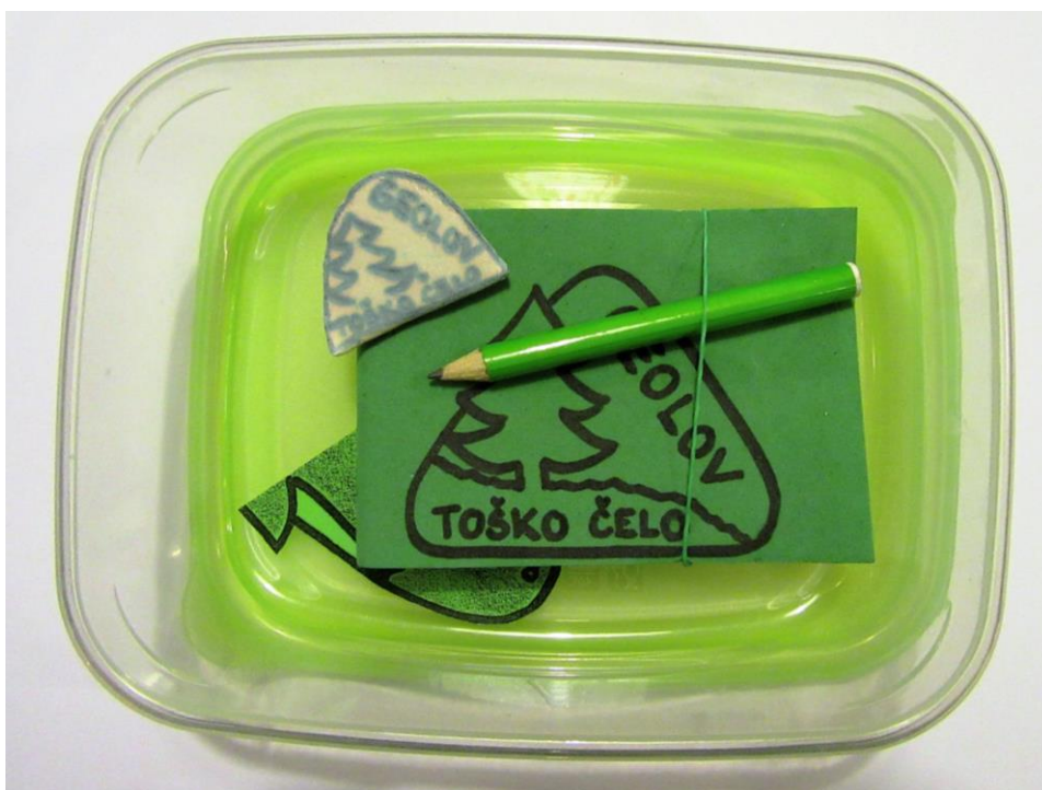
Slika 11: ZAKLAD 2 (plastična posoda za shranjevanje mere: 17 x 12 cm, beležka, svinčnik, spominek za izmenjavo)