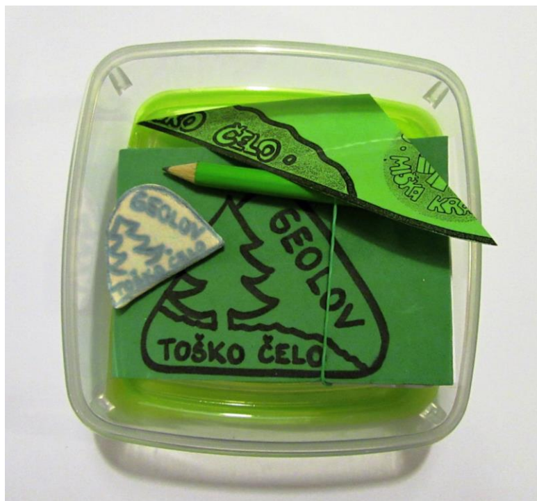
Slika 13: ZAKLAD 4 (plastična posoda za shranjevanje mere: 11 x 11 cm, beležka, svinčnik, spominek za izmenjavo)