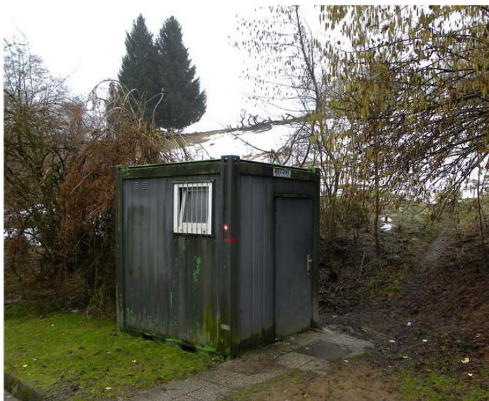
Slika 2: 1. POSTAJA: baraka ob avtobusni postaji – NAMIG: začetek konca

SLIKE POSTAJ OZIROMA TOČK SKRITIH ZAKLADOV TER NAMIGI ZA "ULOV":