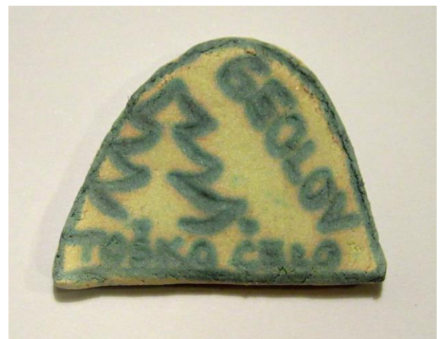
Slika 8 in 9: sestavljeni koščki sestavljanke (plastificiran papir, mere : 10 x 8 cm) ter magnetni spominek za izmenjavo (dasmasa, magnet, mere 3 x 3 cm)